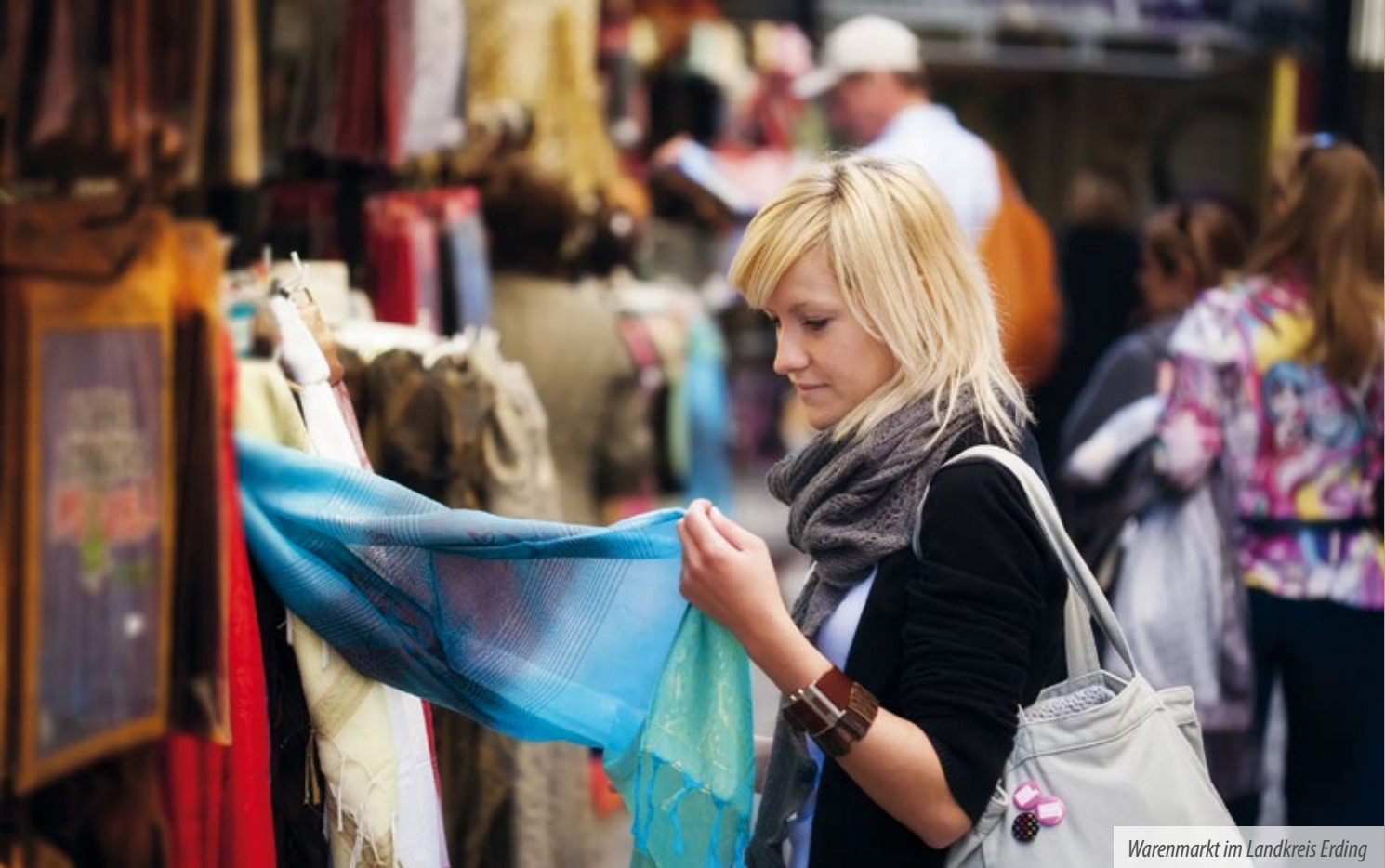
Warenmarkt im Landkreis Erding