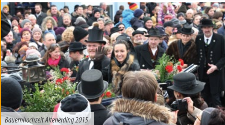
Bauernhochzeit Altenerding 2015