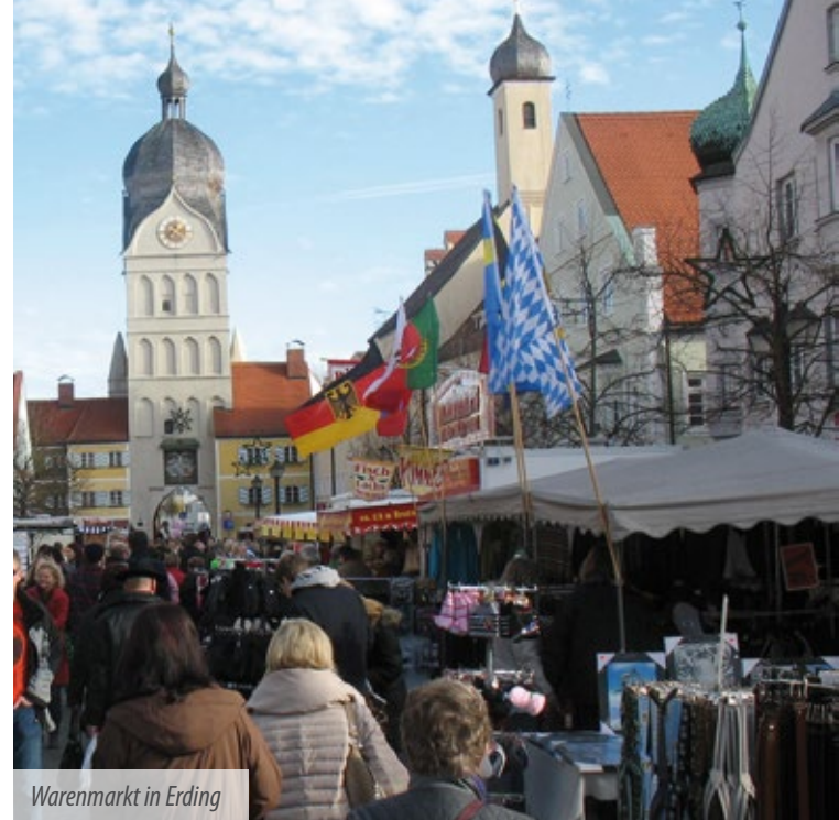
Warenmarkt in Erding

Die Märkte sind fester Bestandteil im Jahreslauf und erfreuen sich immer noch großer Beliebtheit. Das Angebot reicht von Gegenständen des täglichen Gebrauchs über Textilien bis hin zu Spielzeug und vielem mehr. Auch für das leibliche Wohl wird auf den Märkten bestens gesorgt.