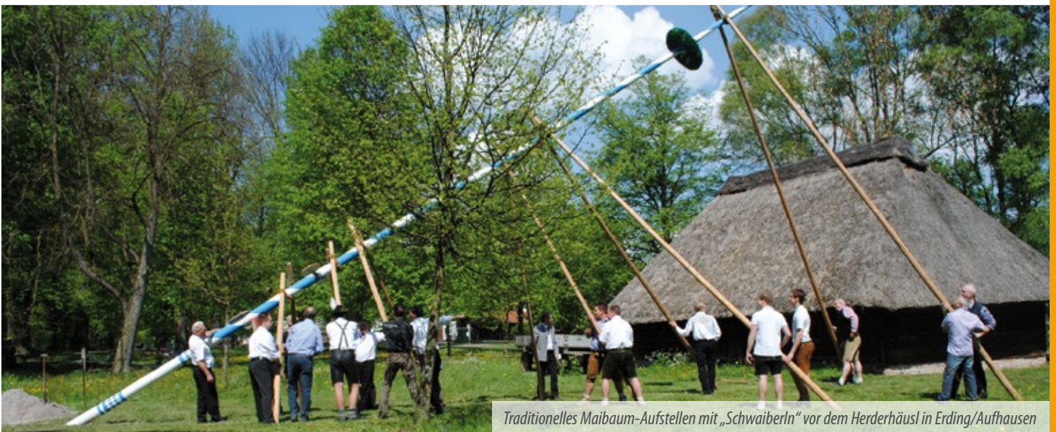
Traditionelles Maibaum-Aufstellen mit „Schwaiberln“ vor dem Herderhäusl in Erding/Aufhausen