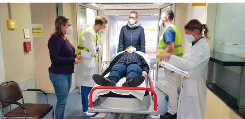
Das Stroke Team Training basierte auf einem bewährten Konzept der Universitätsklinik Frankfurt von 2012 und zielte darauf ab, die Prozesszeiten zu verbessern, die Patientensicherheit zu erhöhen und die Zusammenarbeit im interdisziplinären Team zu optimieren

Center des Klinikums der Universität München übten die Teilnehmerinnen und Teilnehmer komplexe Situationen bei einer Geburt.