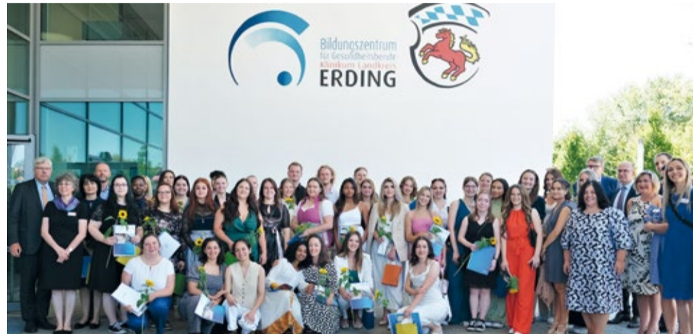
Premiere am Bildungszentrum für Gesundheitsberufe: Erstmals konnten Absolventinnen und Absolventen der neuen generalistischen Pflegeausbildung ihre Abschlusszeugnisse in Empfang nehmen

Das Klinikum Landkreis Erding begrüßt herzlich neun neue Gesundheits- und Krankenpflegekräfte aus