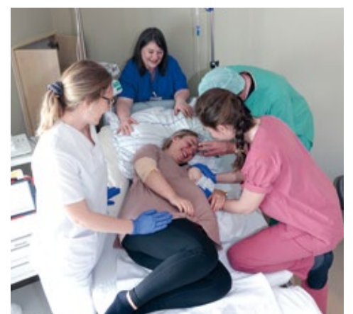
Geburt: Eine professionelle Darstellerin spielte mithilfe einer lebensgetreuen Attrappe mögliche Szenarien geburtshilflicher Notfälle auf die die Teilnehmerinnen und Teilnehmer schnell, kompetent und einfühlsam reagierten